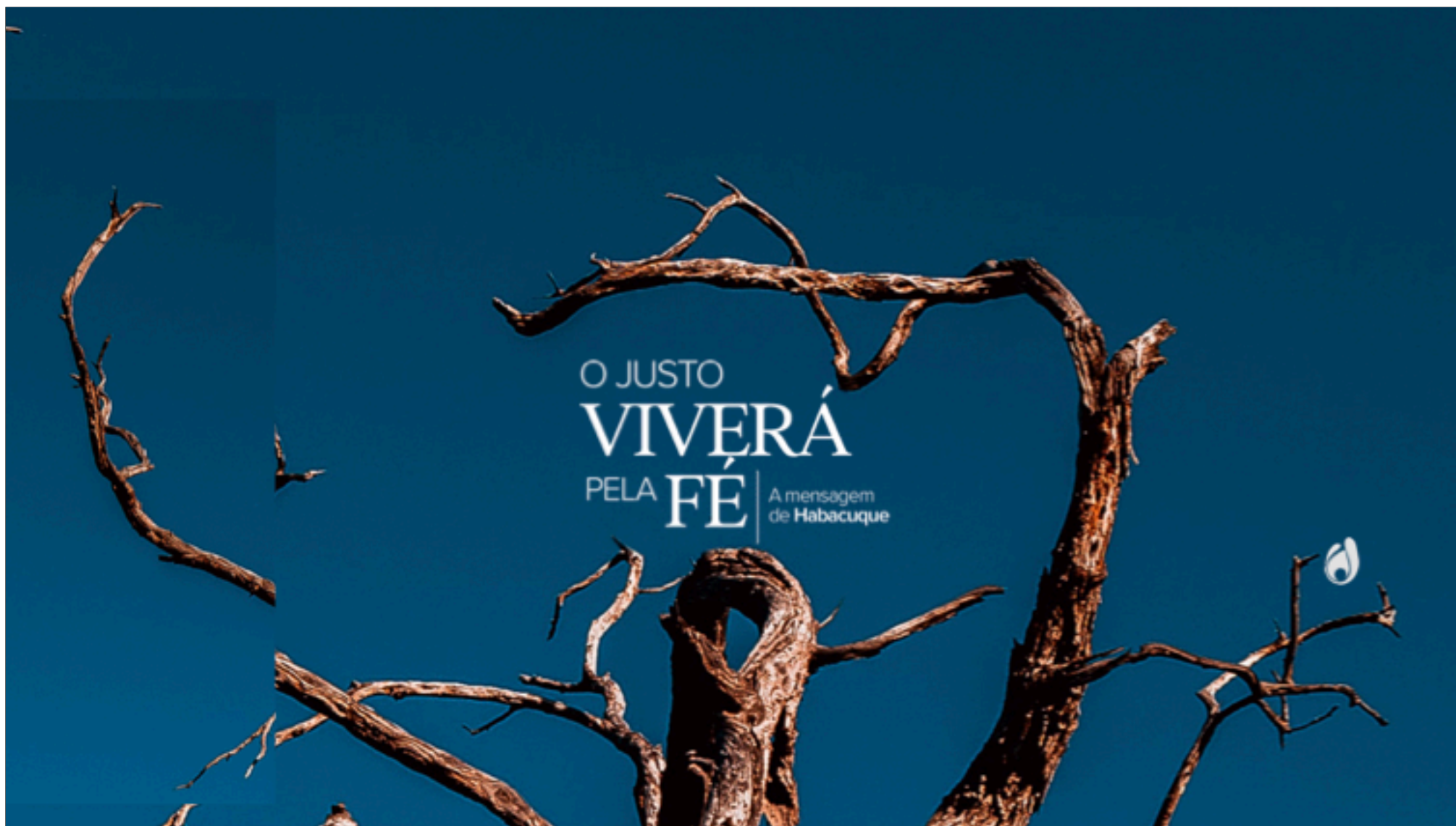
#3. 11_06_23 - O JUSTO VIVERÁ PELA FÉ - A mensagem de Habacuque - Habacuque 3 - André Fontana.key - 20 de dezembro de 2024